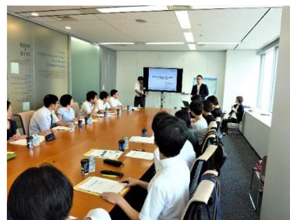
兼松(株)のコーヒー・ビジネスの説明を受け意見交換