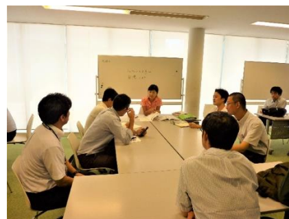
国際交流会館で留学生の日本語講座を視察

東京都教職員研修センターから高等学校、特別支援学校等の教諭15名を受け入れ、未来を担う高校生などが広い視野を持つことを目的に、国際理解向上に向けた研修を行いました。研修では、東京税関(本関と羽田税関支署)が行う業務や兼松(株)が行うビジネス、JICAが行う業務、ABICが行う留学生の日本語研修について視察を行いました。