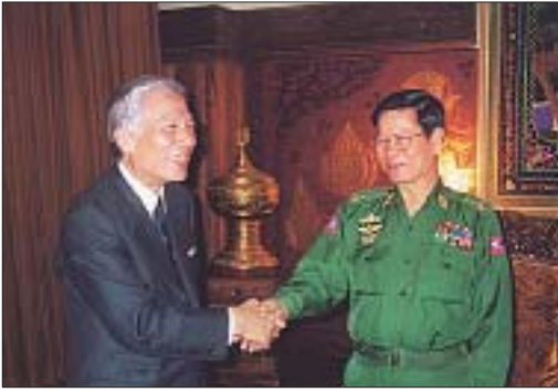
ミャンマー訪問時のキン・ニュン第一書記との面談 (2001年2月28日)