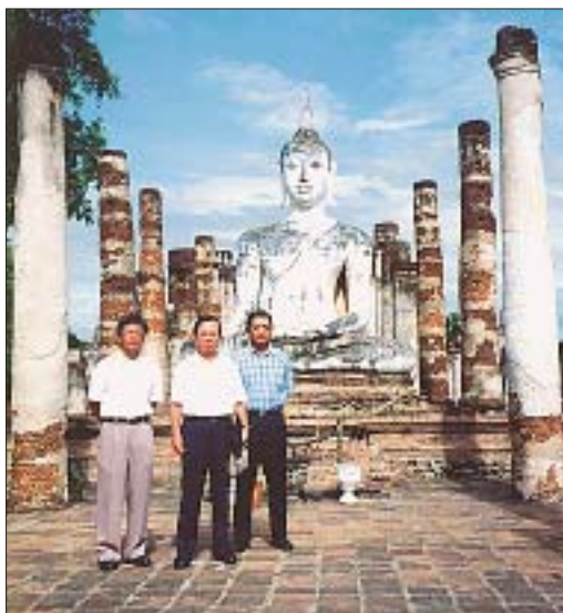
タイ文化への理解を深めるべく訪れた“仏陀も微笑む”スコータイ遺跡。活発な経済交流は、相互理解なくして成り立たない。