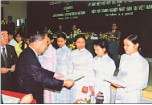
ダナン大学での奨学金授与式（2002年4月4日）

として、投資環境はかなり改善されつつあります。また、ベトナムは、WTO加盟によってますます経済活動が活発になるであろう中国や、通貨危機を乗り越えて回復基調にあるタイなどと隣接しており、地政学的にも極めて恵まれた場所に位置しています。加えて、昨年末に米越通商協定が発効したことから、今後は対米ビジネスの拡大も見込まれます。