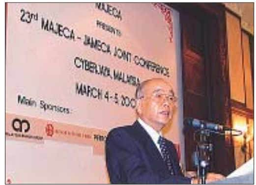
日・マ経済協議会での基調講演

巨大な潜在的成長力をもつ消費市場への参入というChanceと、中国製品に対抗するため自国の競争力の強化にChallengeするという両面で、中国の成長を自国の成長に取り込むとの方針がこの1年間で顕著になったとの印象が強い。このことは、他のほとんどすべてのASEAN各国に共通している。競争力強化のために欠かせない労働生産性向上の問題が、現地日本人商工会議所（JACTIM）が提