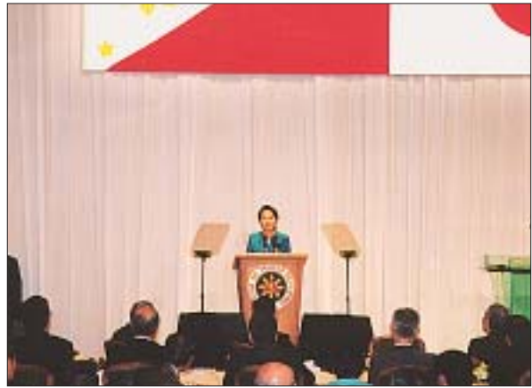
日比経済合同委員会でのアロヨ大統領スピーチ(昨秋 於:東京)

一例を挙げれば、システム・エンジニアや設計技師等、IT関係を中心とするサービス産業分野であり、また、将来的には介護ビジネス