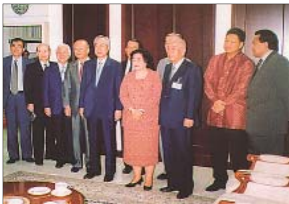
メガワティ大統領との懇談 (2002年4月 経団連ミッション訪問時)

ンドネシアは、いまだ多くの改革すべき課題を抱えながらも、ようやく回復への軌道に乗り始めている。ただ、巨額の公的・私的債務の返済が軌道に乗るには、4%以上のGDP成長を要することから見れば、個人消費の回復に加え、設備投資の回復が喫緊の課題となる。インドネシア経済の発展には、まだ時間がかかり、当面、海外からの資本・技術・人的支援がどうしても不可欠と思われる。投資・貿易の促進、政府開発