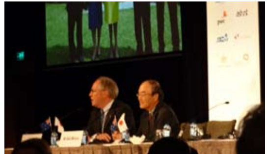
(左：エディントン豪日経済委員会会長、右：三村日豪経済委員会会長)

最後に、日豪／豪日経済委員会の両会長は、日豪EPAの早期締結に向けて、両委員会が引き続き積極的に発信していくしかない述べ、日豪EPAについて、両国政府に政治的リーダーシップを求め、50周年というこの記念すべき年に締結することを期待する共同声明を採択した。