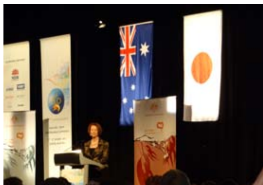
ジュリア・ギラード首相