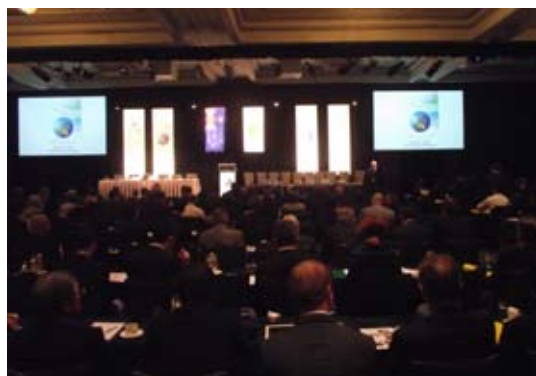
会場の様子 (Four Seasons Hotel Sydney)

最終全体会議「将来への旅立ち」では、これからの日豪関係のさらなる進展に向けた両国の在り方について、討議が行われた。参加